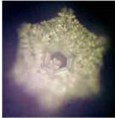
alte, vergessene Heilquelle

Dr. Masaru Emoto zeigt uns einzigartige Fotos von Wasserkristallen. Jede Art von Schwingungen mit guter oder negativer Information wird vom Wasser gespeichert. Dies ist ein Hinweis auf die Beziehung zwischen der Schönheit und Ausprägung der Kristallform und der Wasserqualität. Die Bilder sprechen für sich: